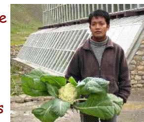
Chou-fleur cultivé dans la serre de l'école