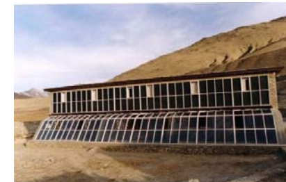
L'école bioclimatique construite par A.Dolpo

En 2009 a commencé la création d'un nouveau poste de santé. Bioclimatique, comme l'école, ce bâtiment permettra aux Dolpopa de disposer d'un dispensaire spacieux, lumineux et sain pour se soigner dans leur vallée. Une serre apportera là