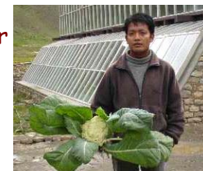
Chou-fleur cultivé dans la serre de l'école