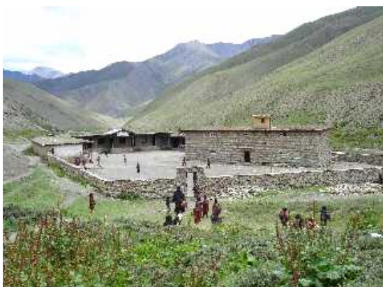
Le village et l'école de Dho, dans la vallée de la Tarap