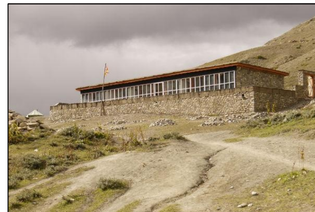
Le dispensaire bioclimatique